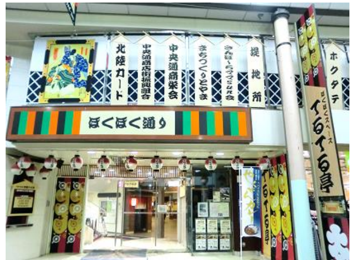
中央通り側（正面入口）