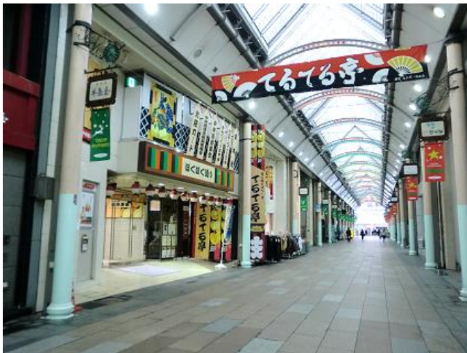
中央通りと正面入口