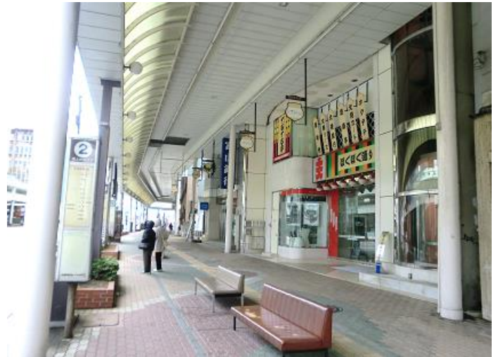
堤町通り側（正面入口）