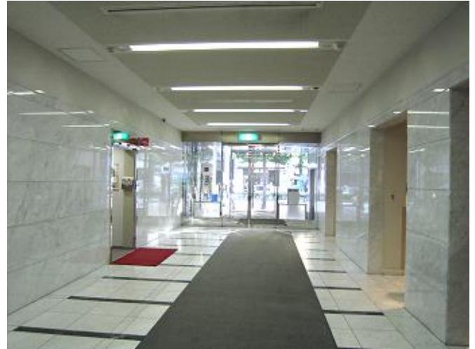
エントランスホール（入口側）