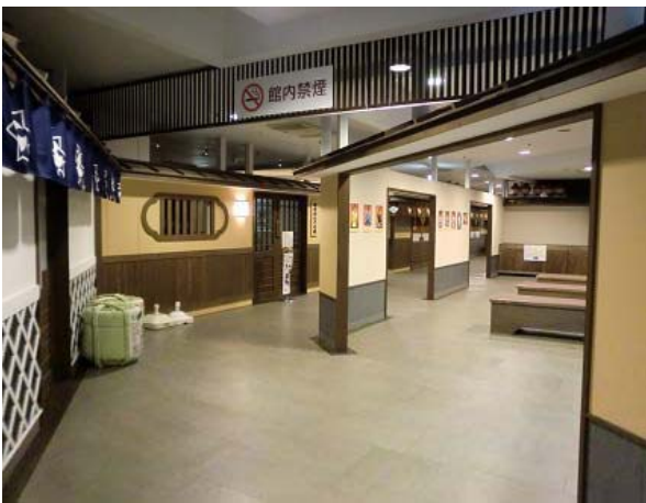
～ 通路 — お休み処～