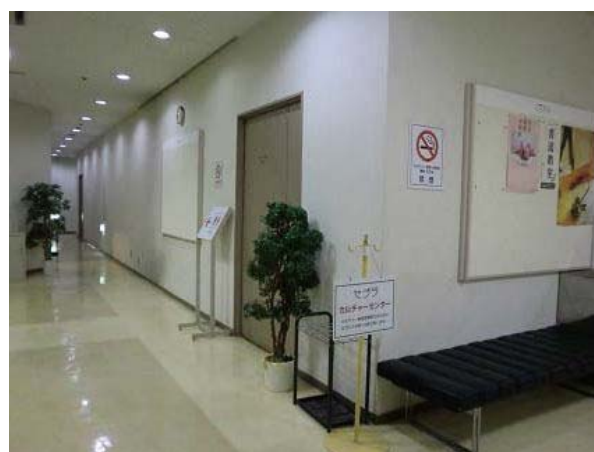
～6F カルチャーセンター～