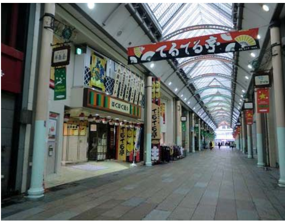
～ 中央通りと正面入口～