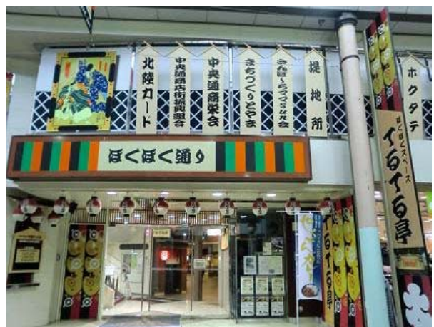
～ 中央通り・正面入口～