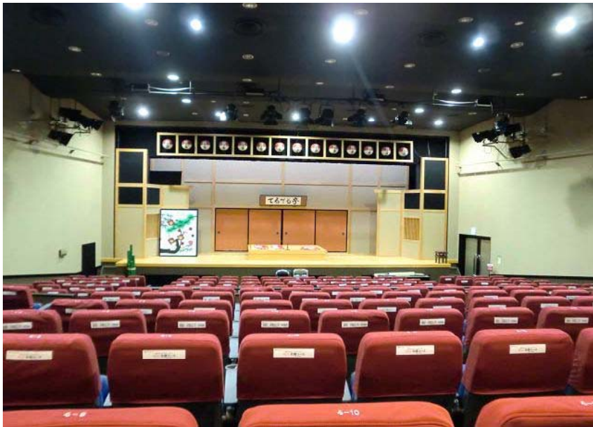
～ てるてる亭・内部 ～