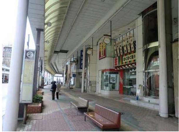
～ 堤町通りと正面入口～