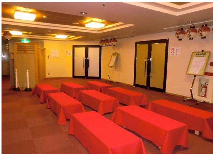
～ てるてる亭・ロビー ～