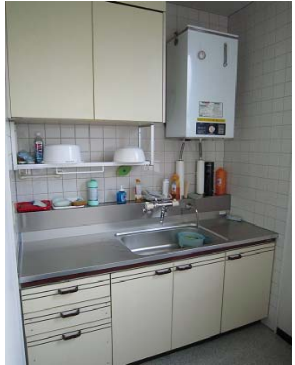
～ 流し場 ～