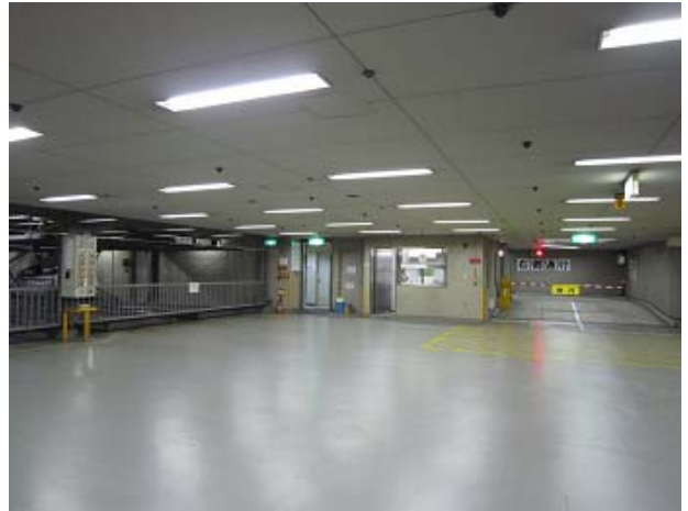
～ 地階・駐車場 ～