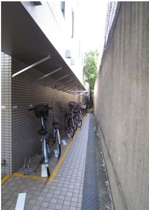
～ 西側駐輪場 ～