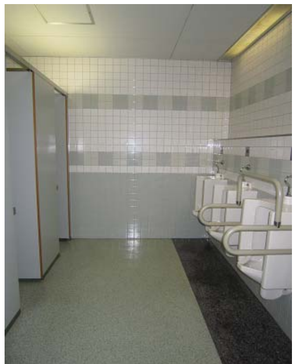
～ 男子WC ～