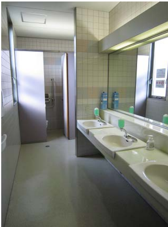
～ 女子WC ～