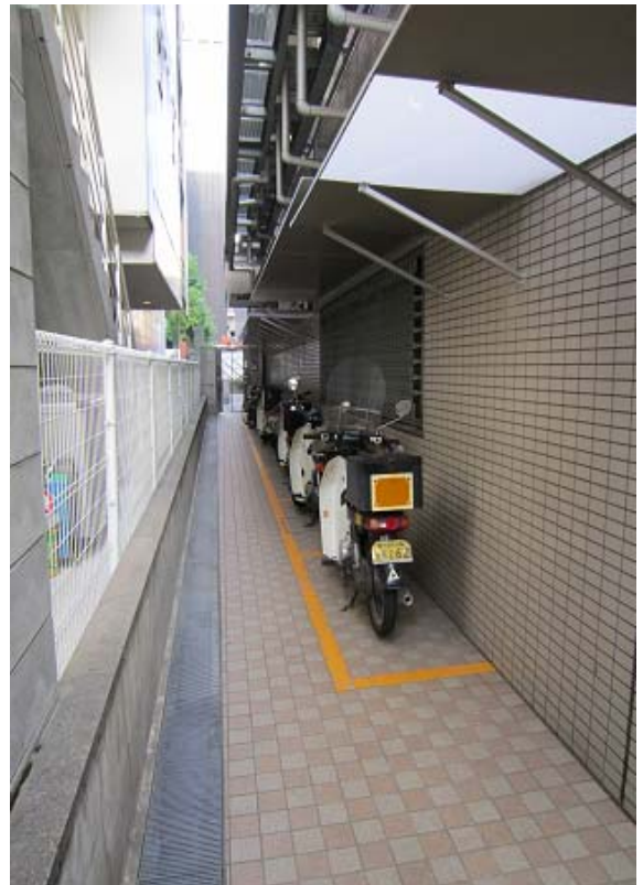
～ 北側駐輪場 ～