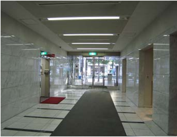
～ エントランスホール(入口側)～