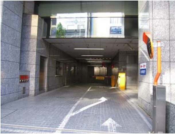
～ 駐車場入口 ～