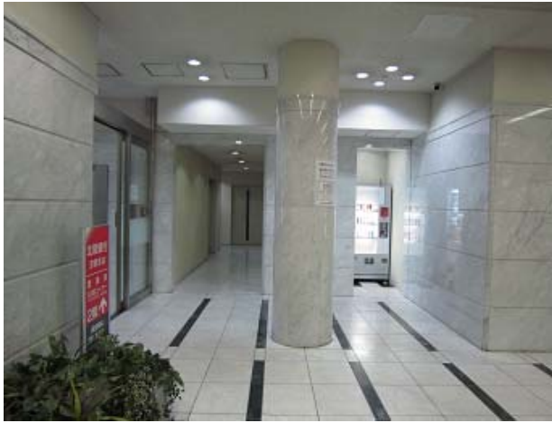
～ 1階・共用ホール ～